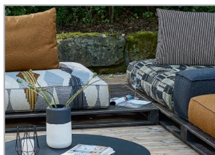
...auf stylischer "Wooden Base"