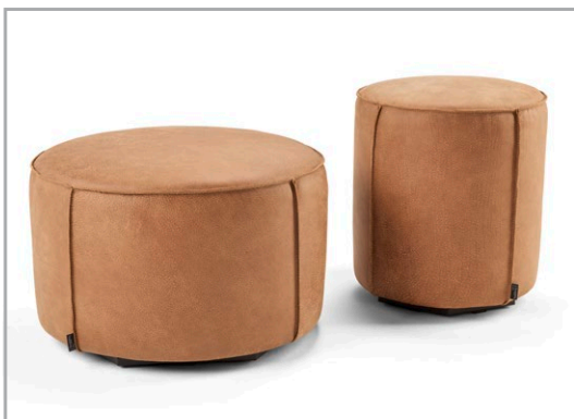
Erhältlich in zwei Größen