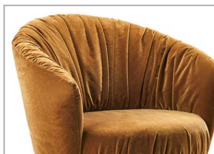
Bequeme Rückenlehne mit dekorativer Plissierung