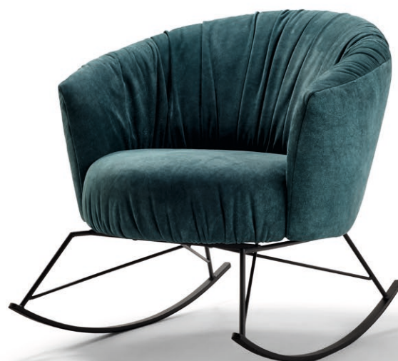
Typ 109, Leder