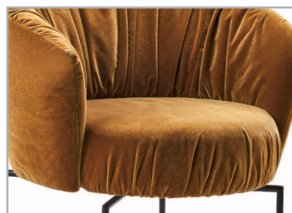
Sitzkomfort mit Taschenfederkern