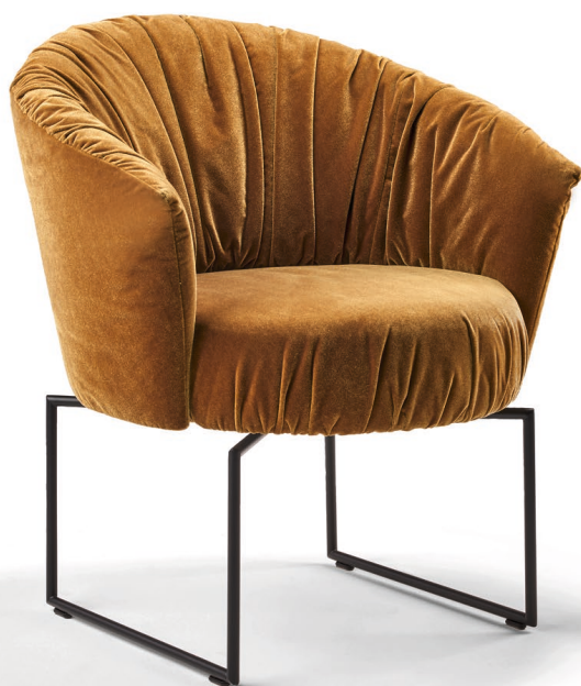
Typ 146, Stoff