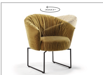
360° Drehfunktion auf filigranem Gestell