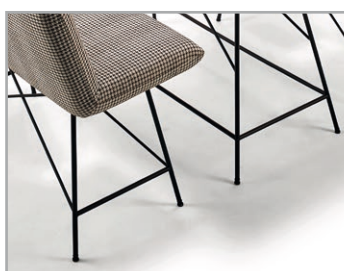
Filigranes Untergestell, schwarz matt Feinstruktur pulverbeschichtet