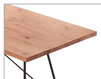
Massivholzplatte in verschiedenen Holzvarianten oder mit Tischplatte aus Beton