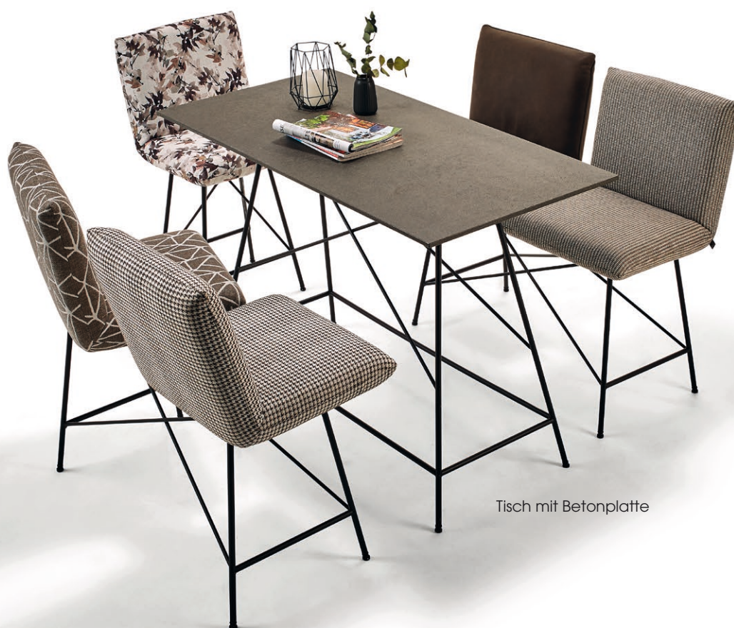
Tisch mit Betonplatte