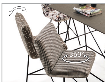
Drehfunktion (360°) und individuelle Rückenverstellung